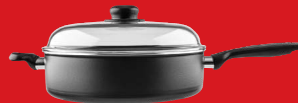
Sauteuse with glass lid | Σωτέζα με γυάλινο καπάκι