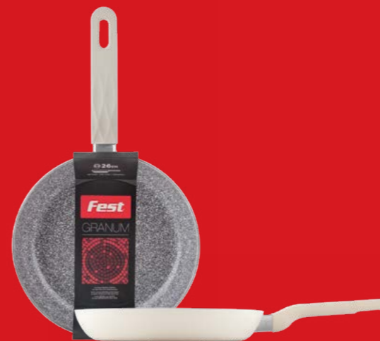
Frypan deep electrical with ceramic coating Τηγάνι βαθύ ηλεκτρικό με κεραμική επίστρωση 3221028 N28