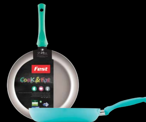
Frypan | Τηγάνι 0061521 N26