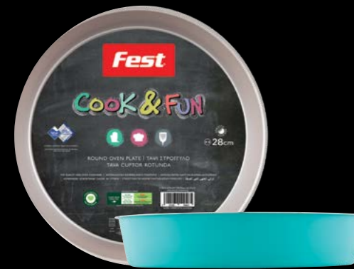
Round oven plate Ταψί στρογγυλό 0061525 N28