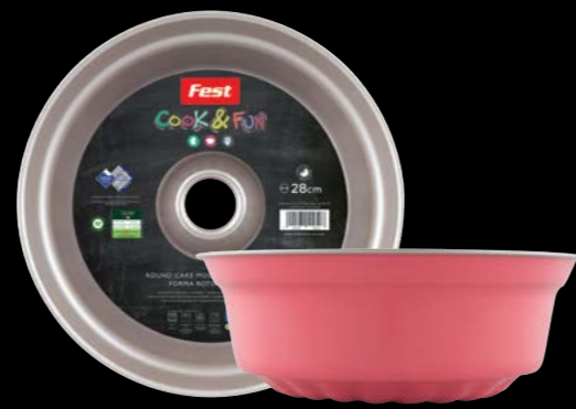
Round cake mould Φόρμα στρογγυλή για κέικ 0061527 N28