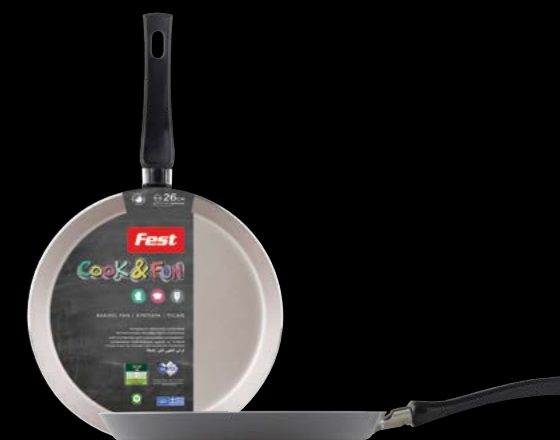
Baking pan for crepes | Κρεπιέρα 0061523 N23