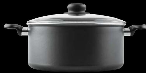
Round casserole with glass lid Χύτρα με γυάλινο καπάκι

0061037 N22 4 lt | 0061038 N24 5 lt | 0061039 N26 6 lt