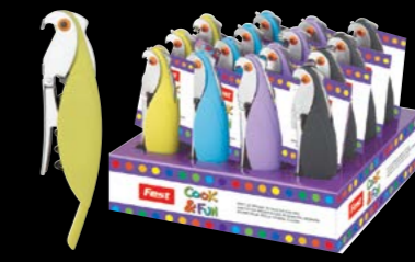
Bottle opener Ανοιχτήρι μπουκαλιών 4945501