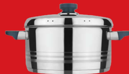
Round casserole with lid | Χύτρα με καπάκι

0066050 N20 3lt | 0066051 N22 4lt | 0066052 N24 5lt 0066053 N26 6,6lt | 0066054 N28 8,3lt