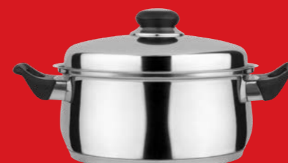
Round casserole with lid | Χύτρα με καπάκι