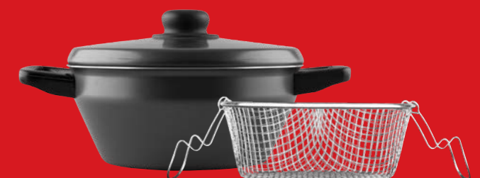
Potato fryer with basket | Φρυτούρα με καλάθι

0061150 N20 3 lt | 0061151 N22 4 lt | 0061152 N24 5 lt 0061153 N26 6 lt