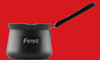
Coffee pot | Μπρίκι

0061160 N3 0,175 lt | 0061161 N4 0,240 lt | 0061162 N5 0,380 lt 0061163 N6 0,535 lt | 0061164 N7 0,710 lt | 0061165 N8 0,915 lt