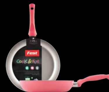
Frypan | Τηγάνι 0061520 N22

TEFLON™ is a trademark of The Chemours Company FC, LLC, used under license by YALCO - SOCRATES D. - CONSTANTINOU AND SON S.A.