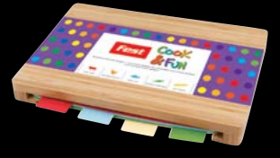
Bamboo & 4 cutting boards Bamboo ξύλο κοπής & 4 βάσεις κοπής 4945008 set 5pcs | σετ 5τεμ.