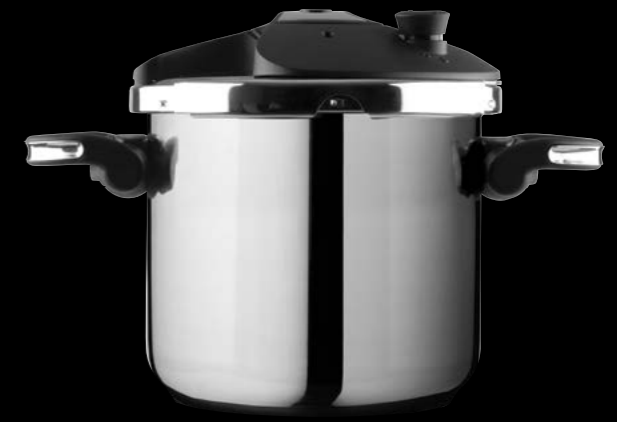
Chronomax Pressure cooker Chronomax Χύτρα ταχύτητας 2382207 7lt 22cm

Folder handles, easy to store Πτυσσόμενες λαβές, εύκολη αποθήκευση