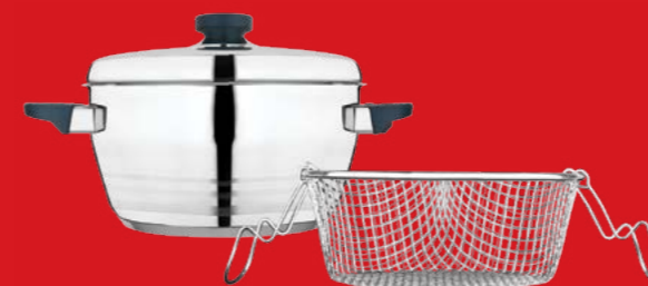
Potato fryer with basket | Φρυτούρα με καλάθι