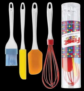
Kitchen utensils set 4pcs silicone Εργαλεία κουζίνας σετ 4τεμ. σιλικόνης 4945009