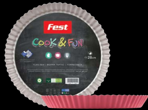
Flan pan | Φόρμα τάρτας 0061526 N28