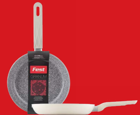
Frypan deep electrical with ceramic coating Τηγάνι βαθύ ηλεκτρικό με κεραμική επίστρωση 3221026 N26