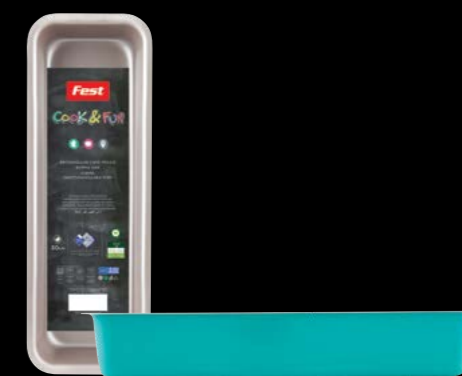
Rectangular cake mould | Φόρμα ορθογώνια 0061528 N35

A colourful cookware line which consists of: