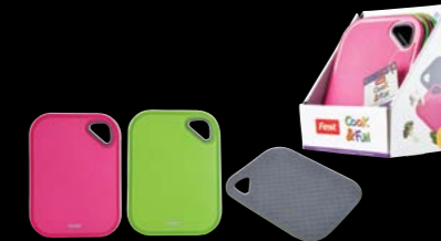
Cutting board | Βάση κοπής 4945056 19x14cm