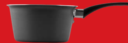
Saucepan | Κατσαρολάκι