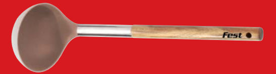
Soup ladle | Κουτάλα σούπας 4943000