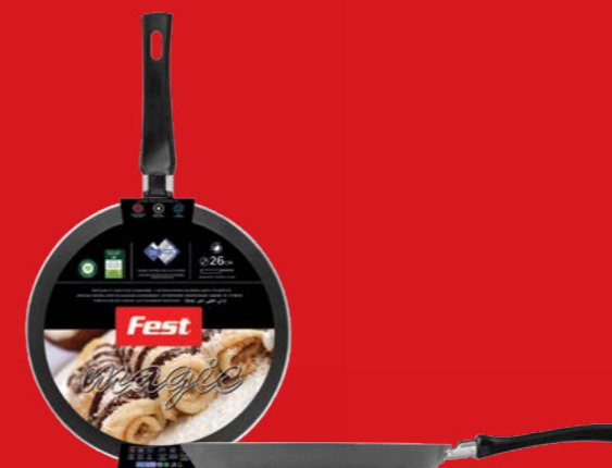
Baking pan for crepes | Κρεπιέρα