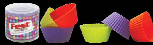
Muffins set 6pcs silicone Muffins σετ 6τεμ. σιλικόνης 4945006

TEFLON™ is a trademark of The Chemours Company FC, LLC, used under license by YALCO - SOCRATES D. CONSTANTINOU AND SON S.A.