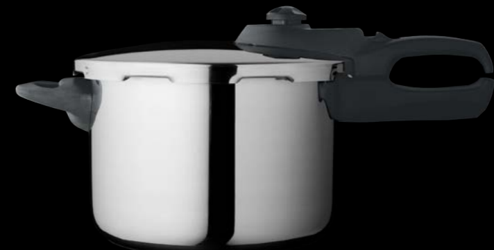
Belissima Pressure cooker Belissima Χύτρα ταχύτητας

2380005 5lt 24cm | 2380007 7lt 24cm | 2380009 9lt 24cm