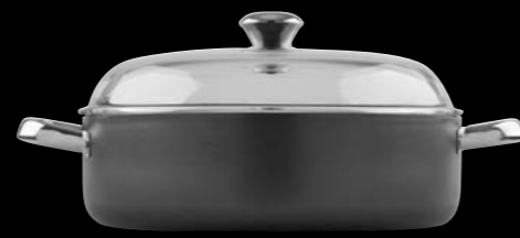
Ταβάς με γυάλινο καπάκι Semi deep casserole with glass lid

0061037 N22 4 lt | 0061038 N24 5 lt | 0061039 N26 6 lt