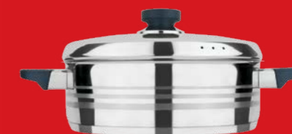
Semi deep casserole with lid | Ημίχυτρα με καπάκι