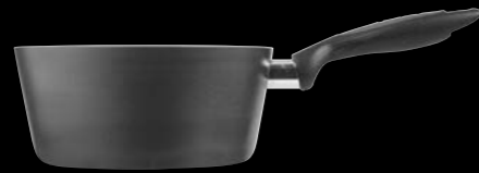
Saucepan | Κατσαρολάκι