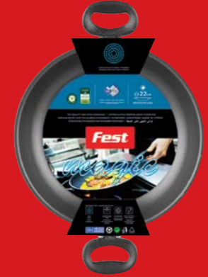
Frypan with two handles | Σαχάνι

0061121 N20 | 0061122 N22 | 0061123 N24 0061124 N26 | 0061125 N28 | 0061126 N30