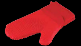
Glove silicone Γάντι σιλικόνης 4945013