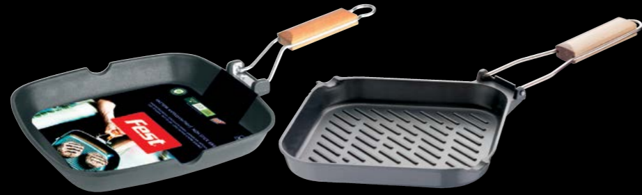
Grill | Ψηστιέρα