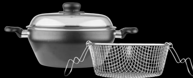
Potato fryer with glass lid Φρυτούρα με γυάλινο καπάκι