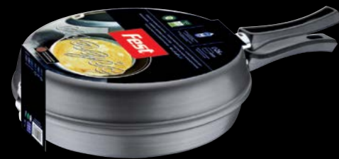
Double pan for omelette | Ομελετιέρα

0061060 N4 0,255lt | 0061061 N5 0,395lt | 0061062 N6 0,540lt