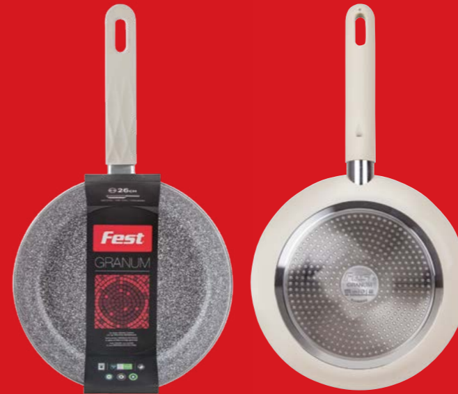
Frypan deep electrical with ceramic coating Τηγάνι βαθύ ηλεκτρικό με κεραμική επίστρωση 3221020 N20

Υψηλής ποιότητας αντικολλητικά τηγάνια από συμπαγές μείγμα αλουμινίου και με κεραμική επίστρωση υψηλής αντοχής. Κατάλληλο και για επαγωγικές εστίες. Μεγάλη αντοχή σε υψηλές θερμοκρασίες έως 230° C.