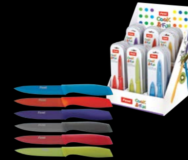
Knife | Μαχαίρι 4945500 12cm