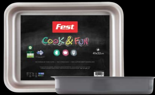
Rectangular oven plate Ταψί ορθογώνιο 0061524 41x32