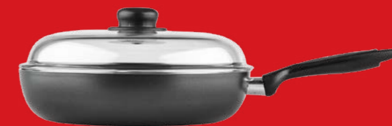
Frypan with glass lid | Τηγάνι με γυάλινο καπάκι