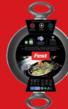
Frypan with two handles | Σαχάνι

0061000 N18 | 0061001 N20 | 0061002 N22 | 0061003 N24 0061004 N26 | 0061005 N28 | 0061006 N30