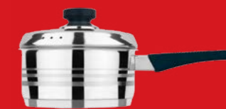
Saucepan with lid | Κασαρόλι με καπάκι

0066050 N20 3lt | 0066051 N22 4lt | 0066052 N24 5lt 0066053 N26 6,6lt | 0066054 N28 8,3lt