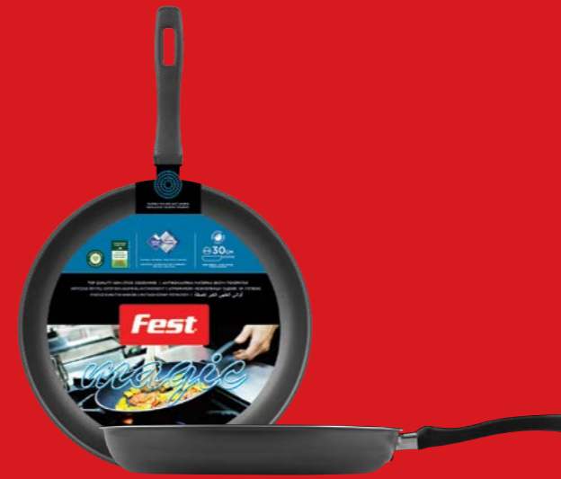
Frypan deep | Τηγάνι θαθύ

0061121 N20 | 0061122 N22 | 0061123 N24 0061124 N26 | 0061125 N28 | 0061126 N30