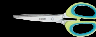
Herb scissors | Ψαλίδι χορταρικών 4945510 19cm