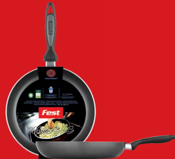
Frypan deep | Τηγάνι βαθύ

Η σειρά Magic είναι μία πλήρης σειρά αντικολλητικών μαγειρικών σκευών για κεραμική / ηλεκτρική εστία, εστία υγραερίου και φούρνου. Κατασκευάζονται από ειδικό κράμα αλουμινίου, με καθαρότητα μετάλλου 99,5%. Η πιστοποιημένη εσωτερική αντικολλητική επικάλυψη με TEFLON™ CLASSIC εγγυάται την μακροχρόνια αντοχή στην καθημερινή χρήση.