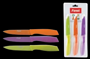
Knife 3pcs Μαχαίρι σετ 3τεμ. 4945503 12cm