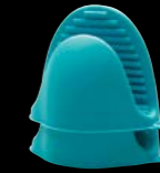
Grabbers silicone Πιάστρες σιλικόνης 4945000 set 2pcs | σετ 2τεμ.