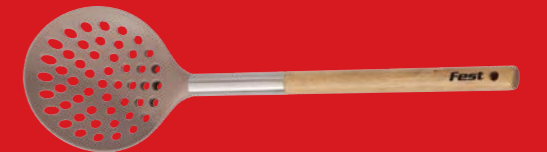
Skimmer | Κουτάλα τρυπητή 4943001