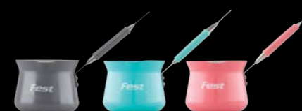
Coffee pot for gas | Μπρίκι υγραερίου 0061530 N5 0,380 lt | 0061531 N6 0,535 lt