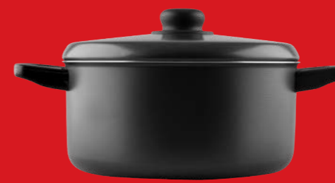
Round casserole with lid | Χύτρα με καπάκι

0061160 N3 0,175 lt | 0061161 N4 0,240 lt | 0061162 N5 0,380 lt 0061163 N6 0,535 lt | 0061164 N7 0,710 lt | 0061165 N8 0,915 lt