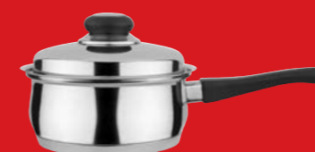
Saucepan with lid | Κασαρόλι με καπάκι