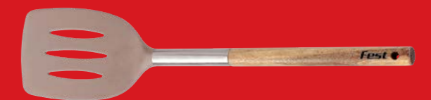
Turner | Σπάτουλα 4943005