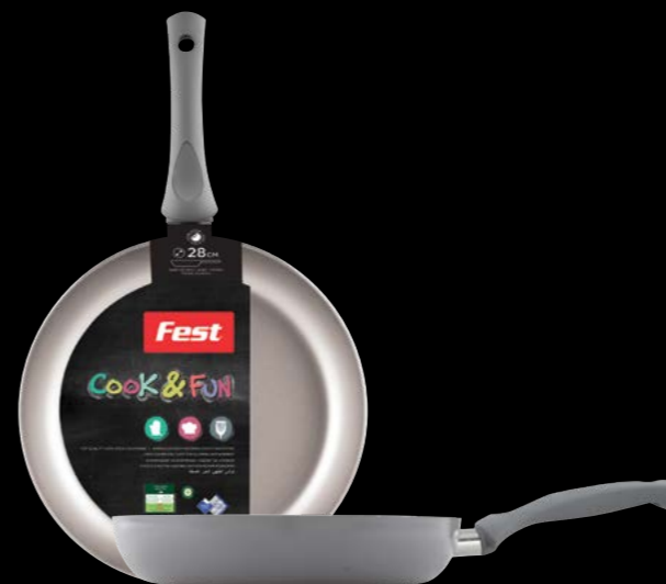
Frypan | Τηγάνι 0061522 N28